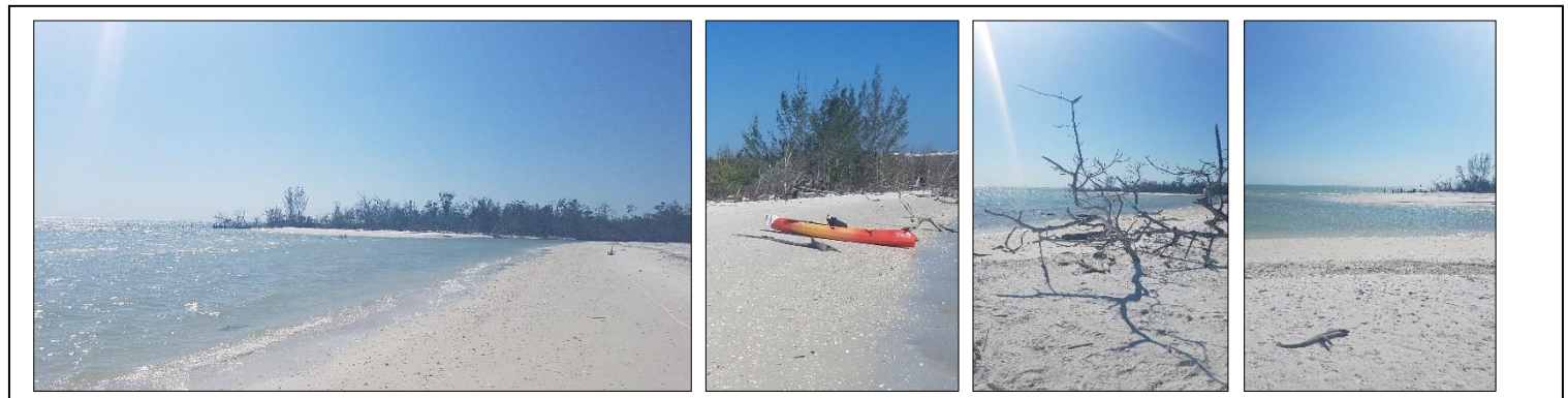
Sea Oat Island

Wenn Sie in der Gegend von Naples und Marco Island Urlaub machen und einmal Ihre Seele an unberührten Strandabschnitten baumeln lassen möchten, machen Sie (mit dem Auto) einen Ausflug in das nahegelegene Isles Of Capri und mieten Sie im Fischlokal „Capri Fish House“ ein Kajak. Damit paddeln Sie durch die Marco Island Bay ca. 20 Minuten in Richtung Südwesten. Die Ruhe ist unbeschreiblich. Sie begegnen Pelikanen und Delfinen hautnah. Auf der rechten Seite der Bay werden Sie nach kurzer Zeit einen weißen Sandstrand auf der unter Naturschutz stehenden Insel „Sea Oat Island“ erblicken. Paddeln Sie auf die Insel, achten Sie bitte jedoch auf vorbeifahrende Boote. Einen kleinen Eindruck sollen Ihnen die unten gezeigten Fotos verschaffen. Die Insel ist ausschließlich mit einem kleinen Boot oder Kajak zu erreichen. Der Sandstrand ist pudrig weiß umgeben von Mangrovenwäldern und Pinienbäumen. Sie werden diesen Ausflug garantiert nie vergessen.