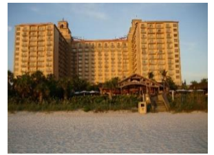
Ritz Carlton Resort, Naples

Das exklusive Ritz Carlton Beach Resort am Ende der Vanderbilt Beach Rd in Nord Naples wird in diesem Sommer knapp 70 Tage für Renovierungsarbeiten geschlossen sein. Am 25. Juni soll mit der Renovierung begonnen werden. Neben einer neuen Fassade für das Gebäude sind auch Veränderungen am Spa Bereich und dem Strandlokal „Gumbo Limbo“ vorgesehen. Die Wiedereröffnung des Resorts ist am 3. September vorgesehen. Das Hotel prüft zurzeit auch, ob ein weiteres Gebäude mit 70 Zimmern Chancen auf eine Genehmigung hätte.