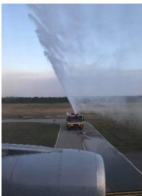
Ankunft der Eurowings in RSW